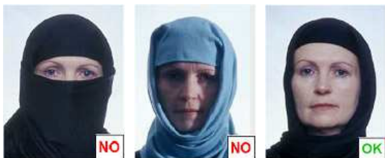
figura 12 bis