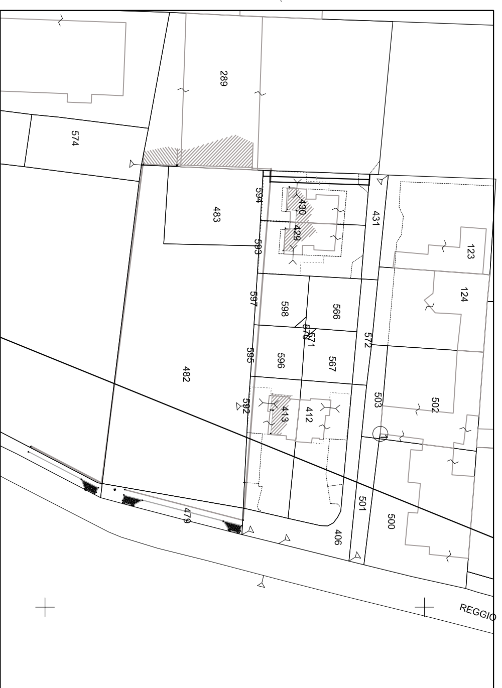
SOVRAPPOSIZIONE MAPPA CATASTALE CON RILIEVO CELEBRIMETRICO