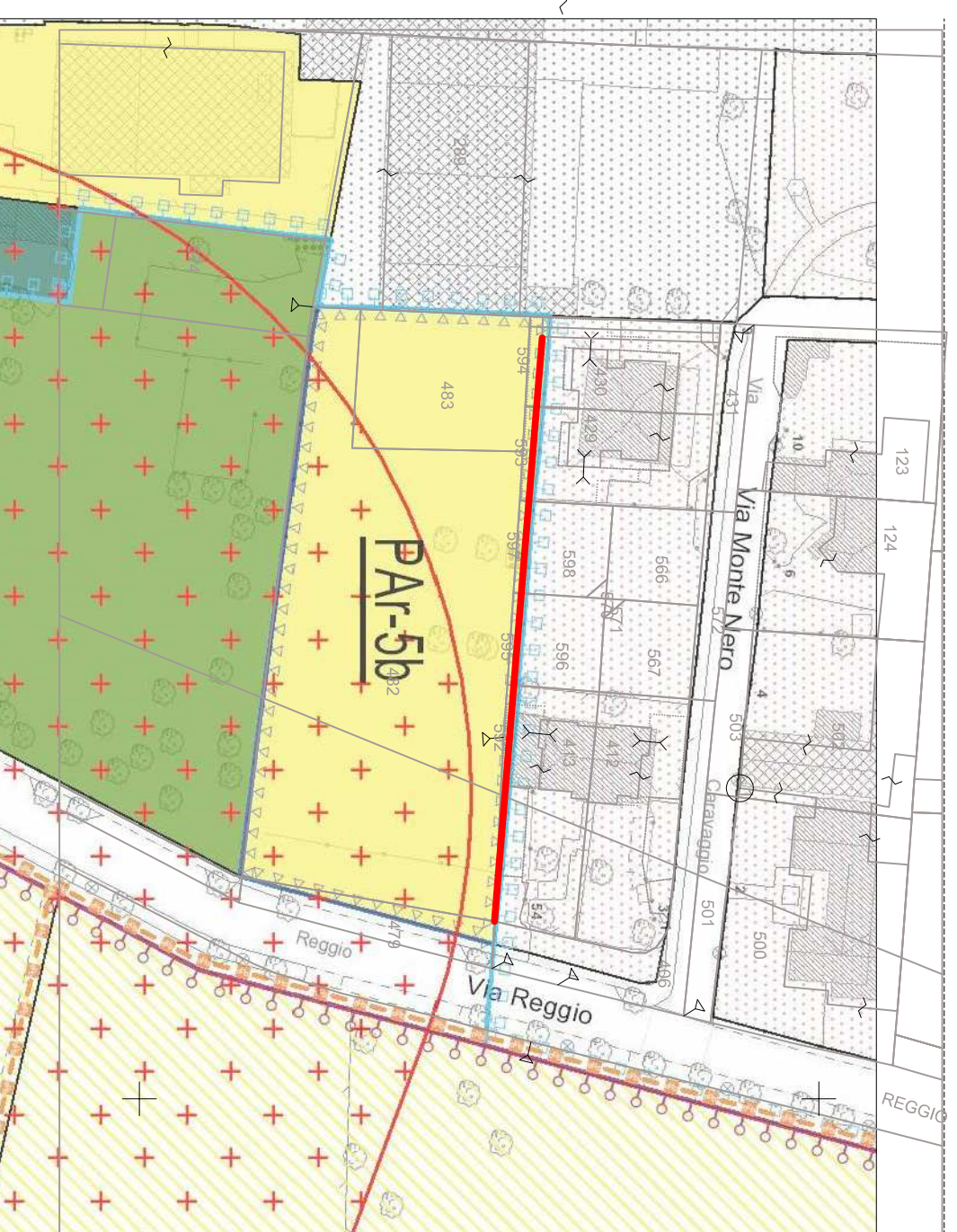
SOVRAPPOSIZIONE PGT E MAPPA CATASTALE

RILIEVO CELEBRIMETRICO COMUNE DI SEREGNO FOGLIO 31 MAPPALI 482 E 483 SCALA 1/500 PAR 5b