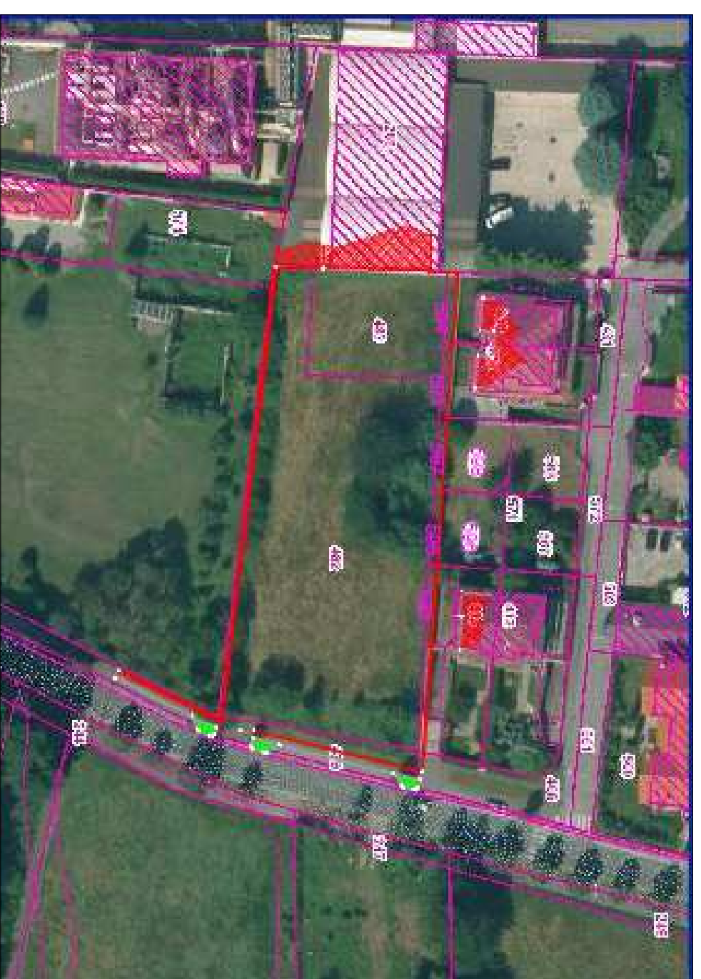
SOVRAPPOSIZIONE CATASTO CON ORTOFOTO