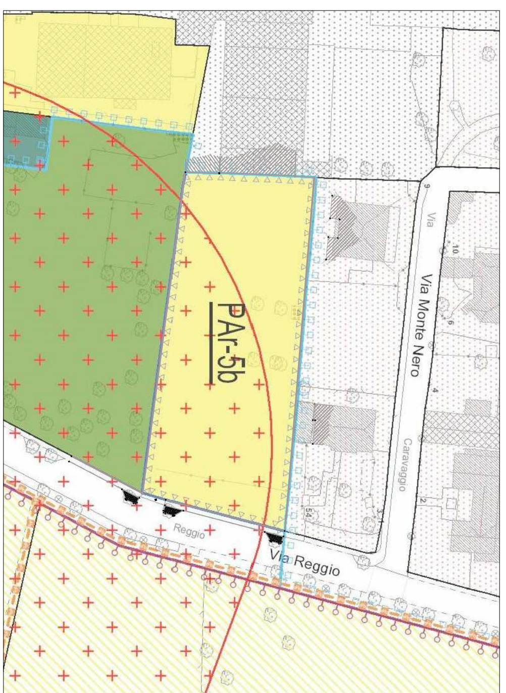
SOVRAPPOSIZIONE P.G.T. CON RILIEVO CELEBRIMETRICO